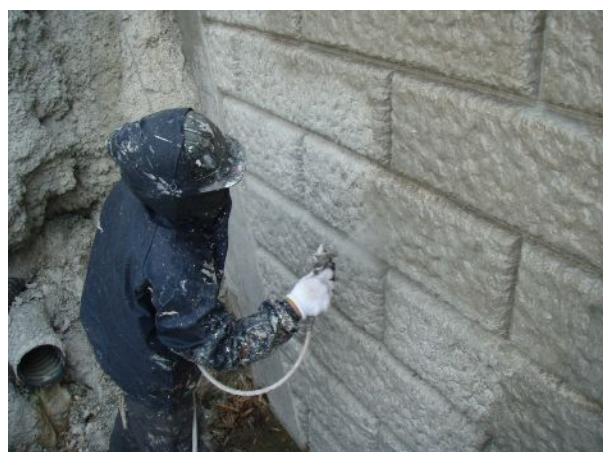
凹凸面は吹付けで施工