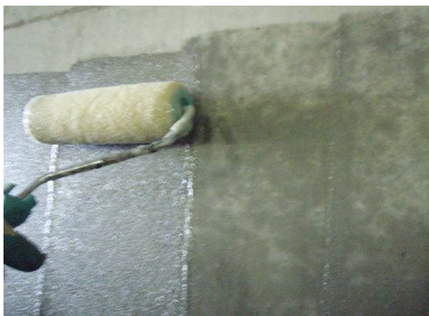
平滑面は砂骨材ローラー(7インチ、極細目)にて施工