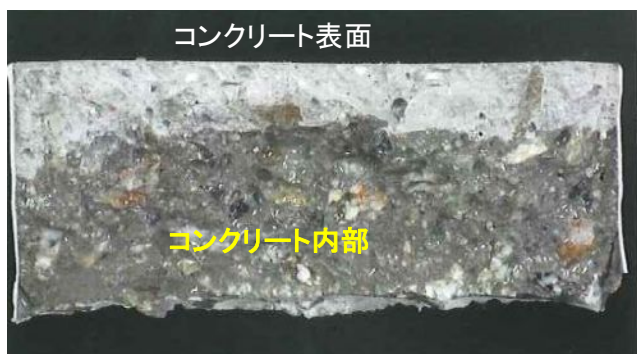
吸水防止層に撥水効果あり