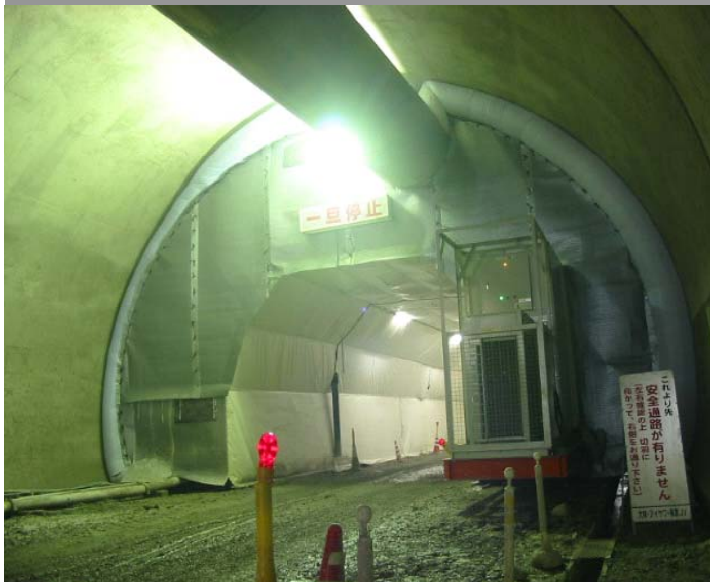
集塵機エアコン搭載型セントル養生