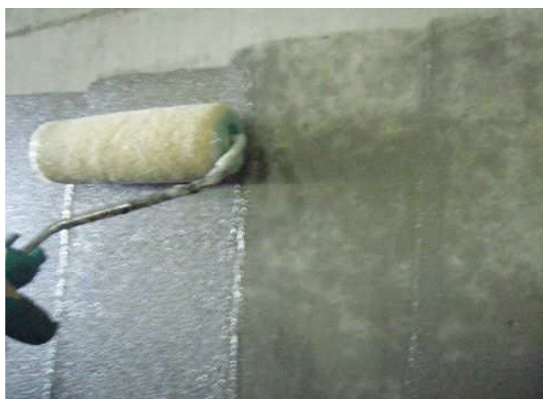
平滑面は砂骨材ローラー(7インチ、極細目)にて施工