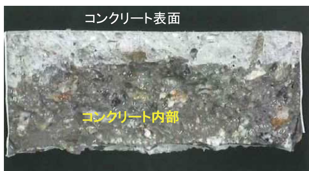
吸水防止層に撥水効果あり