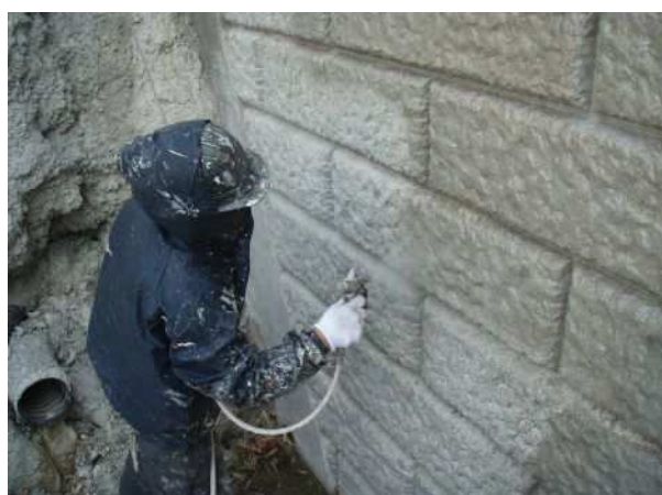
凹凸面は吹付けで施工