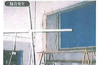
隣接の実験検査室で測定