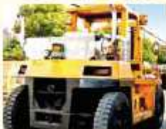
フォークリフト作業では…

一般・作業車両、停まって作業する車、非常用発電機 etc. 全てのシーンに最適！