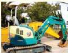
地下鉄・トンネル工事では…