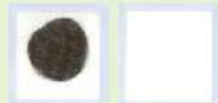
通常の排気 モコビー通過後の排気