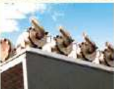
非常用発電機では…