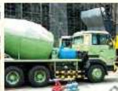
停まって作業する車両では…