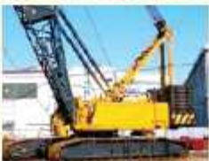
建設作業現場では…