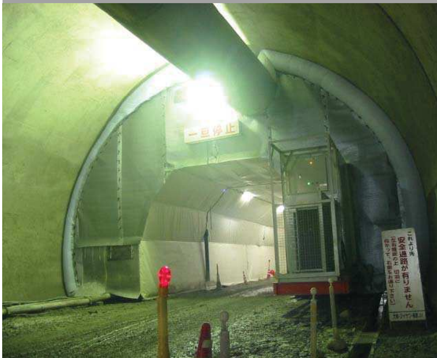
集塵機エアコン搭載型セントル養生