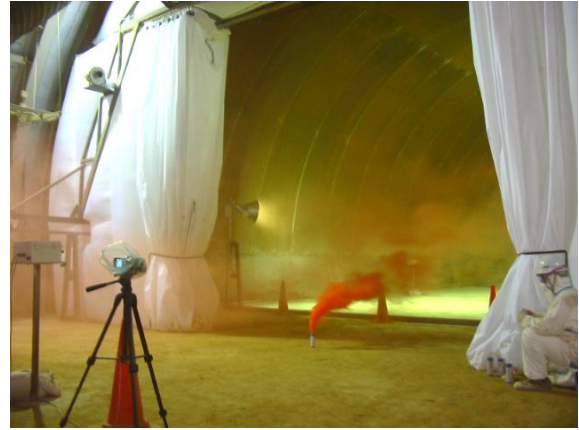
圧力差により切羽側へ風が流れる