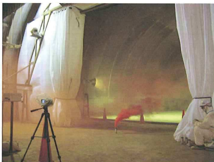
圧力差により切羽側へ風が流れる