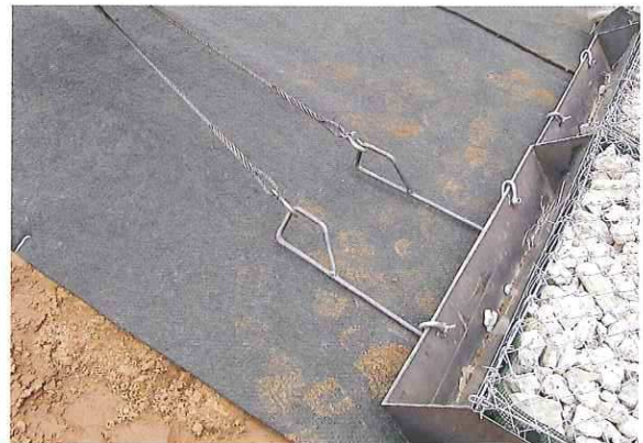
側板・挿し筋・バーを撤去後架台を引き抜く