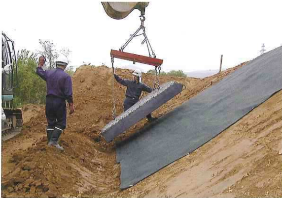
特殊吊り具にてドレンかごを設置