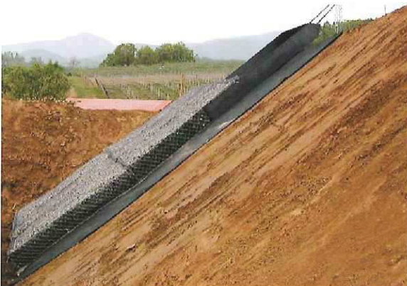
2段目架台引き抜き